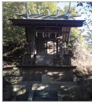
茨城県 北茨城市磯原