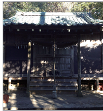
磐破山(たつわれさん) 茨城県 日立市十王町