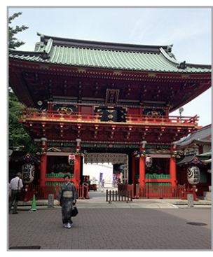
江戸総鎮守 千代田区外神田 2-16-2