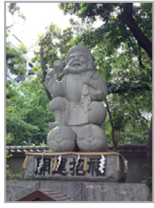
大黒さま メッセージ 「わ」は 「う」は 「い」は 「く」は

補足事項 ※ 人型 (ひとがた) や色について 髪や服はその神様の好きな色にするのが多いようです。 ※ 主祭神・ご本尊様は、献上された酒が一番最後に「口」にされるのが多いようです。 ※ 参拝に来られる方へ、お祭り (盆・正月) など以外は居ない神様もいます。