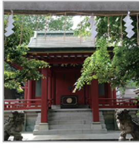
水神社 (魚河岸水神社) ご祭神 弥都波能売命 (みづはのめのみこと) 男性神 食べ物 大根を甘めに煮たもの 飲み物 優しい色をしたものならは何でも 色 肌色

えびす様・少彦名命 メッセージ 「この地はな、少ないものが集まり、大きな地になっておるのじゃ。少ない気も大切に」