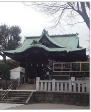
東京都品川区西五反田 5-6-3 (東急目黒線 不動前駅)

主祭神【由緒書きより】 素戔鳴尊、菅田別命、建御名方命、於母陀流神、阿夜訶志古泥神 ※交流した際に大國主命と名乗られました。 男性神(男性的な気) 好物 みかん(子供に似ているから) 飲み物 酒はあまり好きではない 色 白に近い水色(髪の色はまさに水色でした) (正常なる流れの中で無垢な水の色だから) メッセージ 「道を歩むことを止めることなかれ」