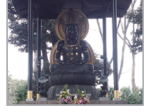
東京都目黒区下目黒 3-20-26 (東急目黒線 不動前駅)

メッセージ 「光に向かい良きことを行いなさい」 ※良きこと・おのが心が求むるもの (おのが心をこらに見つめなさい、その心は求むるものが分かります。) 大日如来 男性神 好物 丸いもち 飲み物 頂けるものは何でも。 気持ちはですから「皆が飲むから何でも良いんです」 色 白 メッセージ 「カミナリ」では、神様交流の際に霊能者を通じてお話を伺っております。 霊能者によつては、見解の相違がある場合がございます。 神社・仏閣の神様との交流を通して広く皆様へ親しみを持っていただければ幸いです。 ご紹介しております。お問い合わせ awanunsub@gmail.com