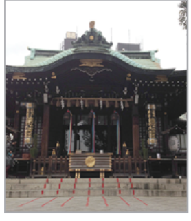
目黒総鎮守 氏神様・土地神様 東京都目黒区下目黒 3-1-2 (東急目黒線 不動前駅)

主祭神 日本武尊(やまとたけるのみこと) 男性神(厳格な方) 好物 米・稲穂のままが好き 飲み物 「豊穣を報告してほしい」 色 気が満ちし時にあらわれる色を好む ※オーラのよくな感覚的な表現で話してくださいました。 メッセージ 「満ちて進むは、神の道なり」