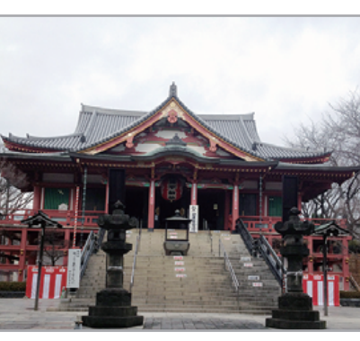
東京都目黒区下目黒 3-20-26 (東急目黒線 不動前駅)

目黒不動尊では、ご本尊の不動明王さま以外にも、沢山の神様と交流させていただきました。今回は、交流させていただいた神様のみをご紹介します。 ご本尊 不動明王 人型(大日如来様と同じ) 男性神 好物 あたりめ 飲み物 米焼酎 色 黒が赤 メッセージ 「やさしき心は人からもうつ 厳しき心は己からもうつ 心は己の鏡なり」