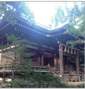
旧奥澤新田村鎮守、旧村社 東京都世田谷区奥沢 5-22-1

「ご祭神 男性神 菅田別命(ほんだわけのみこと) 倉稻魂命(くらいなみたまのみこと)」