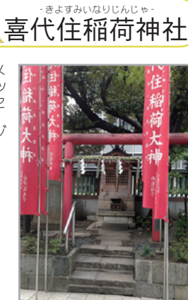
- 境内社 -