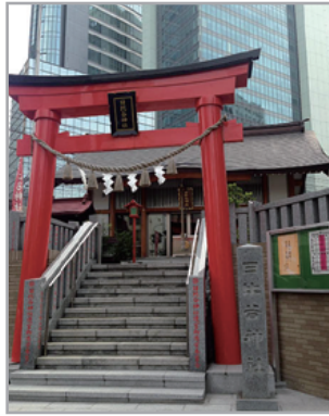
東京都港区東新橋 2-1-1

「祭神 豊受大神（とようけのおおかみ）女性神 挨拶 「私に声を出し呼びかけてください」 好物 大福 酒 「従っているキツネが飲んじゃうから飲んでないわね」 色 青緑