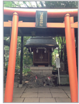
-境内社- 写真のみ掲載