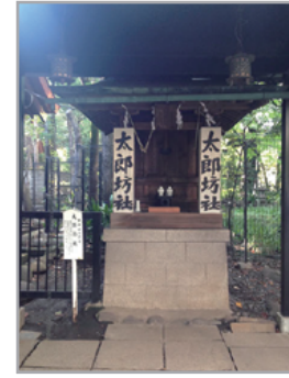
(猿田彦神) -境内社- 写真のみ掲載