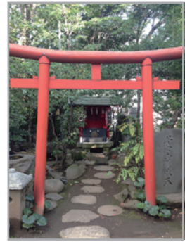
(市杵島姫命) -境内社- 写真のみ掲載