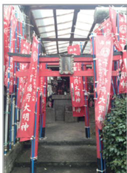
- 境内社 - 写真のみ掲載