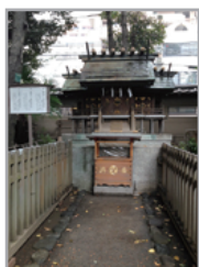
熊野神社 菅原神社 厳島神社 こちらは 写真のみ掲載