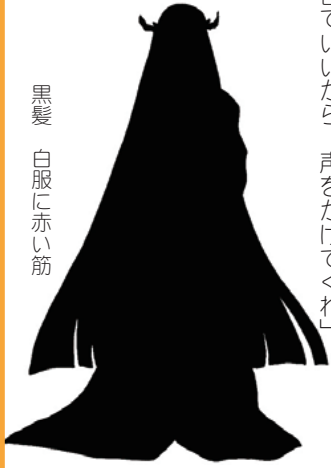
黒髪 白服に赤い筋

「近年希に、声を出さずに参るものがある声を出さねば、我はごうして良いかわからぬ一言でいいから、声をかけてくれ」