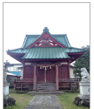
秋田県由利本荘市観音町