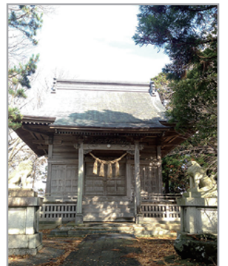
秋田県由利本荘市石脇字東山 4