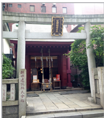
中央区日本橋人形町 1-12-10