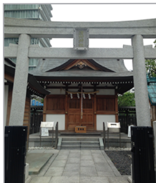
中央区日本橋浜町 3-3-3