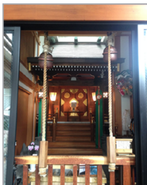
中央区日本橋人形町 2-15-2