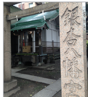
中央区日本橋蛸殻町 1-7-7