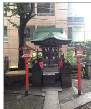
- 境内社 -

挨拶 「来てくれれば分かるよ」 好物 だんご 酒 「主様にあげるから飲まない」 色 白く橙色 風景 「遠く空を見るのが好き」