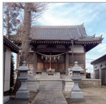
花和田字下河原の鎮守 埼玉県三郷市花和田 416

主祭神 経津主之命 (ふつぬしのみこと) 男性神 好物 煮物 野菜と鳥肉が入っていて、ドロドロになるまで煮込んだ汁物、塩の味の付け(炊きあげて配っていた) 酒 甘酒 「お祭りが好きなのは人が沢山参るから」 色 白 うすい水色