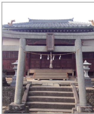
埼玉県三郷市谷口 35

主祭神 倉稲魂命 (うかのみたまのみこと) 男性神 好物 もち大福 白あんが好き 酒 主の花和田香取神社の祭りのあけ、少量頂きます。 貢ぎ物は全て主です。 色 白と赤 赤が入った感じ(白と赤の二色)