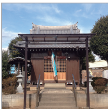
大廣戸村の鎮守社 埼玉県三郷市三郷 3-14-4

主祭神 経津主之命 (ふつぬしのみこと) 男性神 好物 ほつこう 醤油ベース 酒 強めの酒 色 海みたいな深い青 メッセージ 「大変嬉しいこと、この参拝者が多いのでその方々に感謝申し上げます」